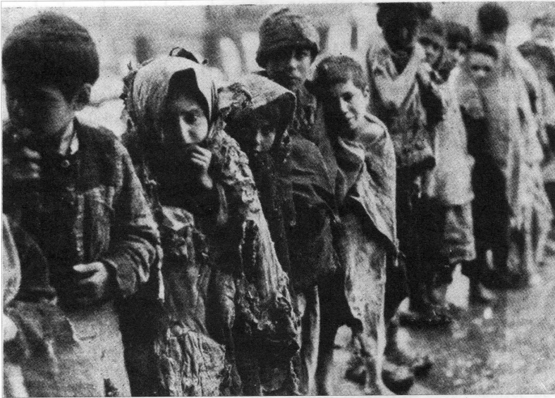
Eine Nation von Flüchtlingen und Waisenkindern - Kinder vor dem Tor der „Waisenstadt“

lichkeit. Doch das politische Europa verhielt sich merkwürdig still in dieser Zeit, das meinte auch der britische Liberale und ehemalige Premier William Ewart Gladstone, als er sich zu einem persönlichen Dankschreiben an Lepsius veranlasst sah, in dem er dem »Autor des wertvollen Buchs über die Massaker an den Armeniern, das mir selbst von großem Nutzen war« seinen persönlichen Respekt bekundete. Das von imperialen Großmachtinteressen statt von politischmoralischen Maßstäben geleitete Bild, das die Regierungen Europas über die Massaker verbreiteten, so Gladstone in Übereinstimmung mit Lepsius, sei »eine der traurigsten, wenn nicht die traurigste Tatsache dieser Zeit.«