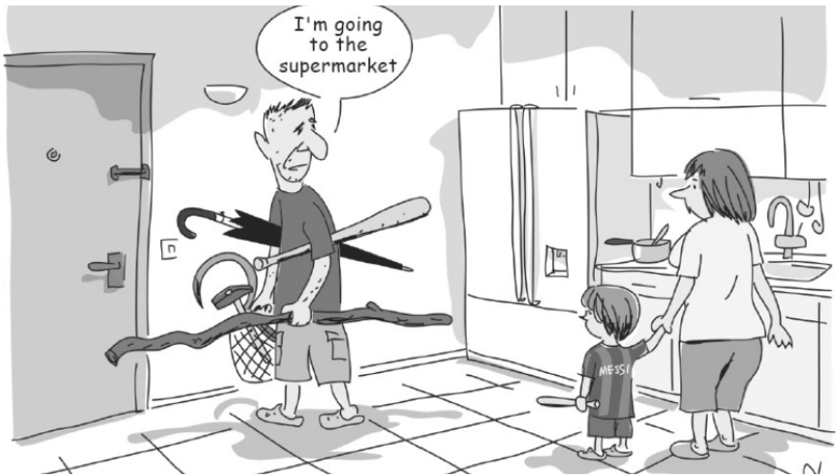
Karikatur in Haaretz zum Artikel auf S. 78f